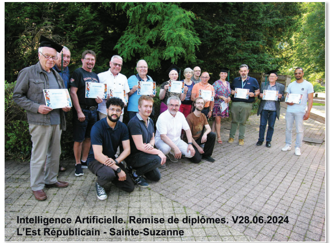
Intelligence Artificielle. Remise de diplômes. V28.06.2024 L'Est Républicain - Sainte-Suzanne