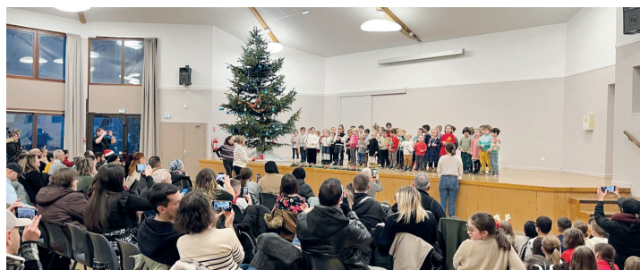
Noël au péri