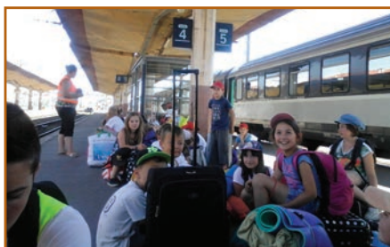
Sortie pour les grands en camps 3 jours à Champagny

La session estivale a été dirigée par Amandine PAWLAK. Une trentaine d'enfants de 3 à 12 ans ont été encadrés par quatre animatrices.