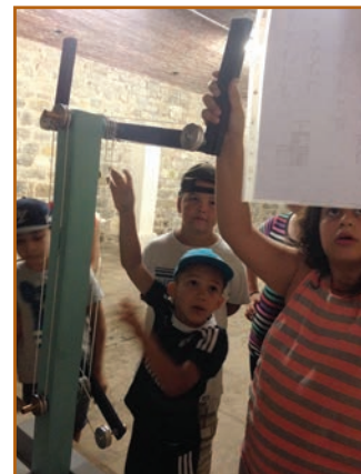
Un grand jeu au fort du Mont Bart