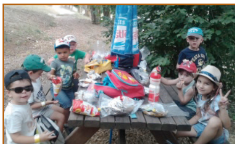
Sortie au parc des Campagnes