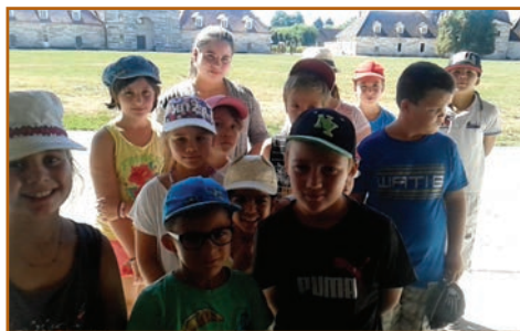
Une journée aux Salines Royales d'Arc-et-Senans